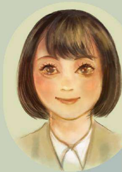
ICHIKA / ローラ・ガスリー <いちか>

スコットフィッツジェラルドの明るく陽気な秘書。 なんと2000人の応募者の中から 厳選なる審査をして選ばれた逸材だとか…。 果たしてどんな審査基準なのか。