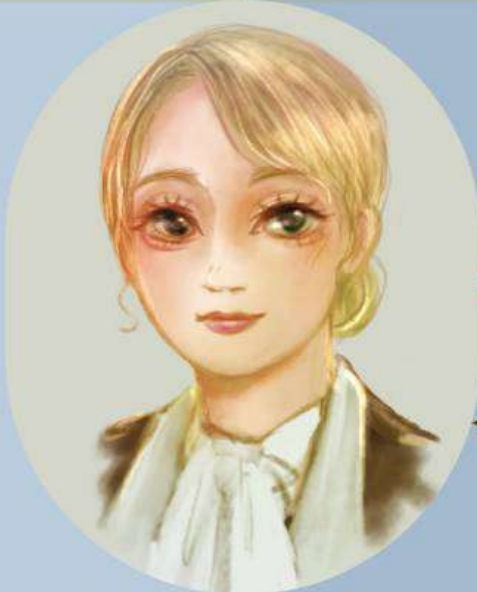
HISUMI / シーラ・グレアム <ひすみ>

スコット・フィッツジェラルドの最後の愛人。 ハリウッドのジャーナリスト。 体調が思わしくない晩年のスコットと同棲し、 その最期まで彼を支えた。