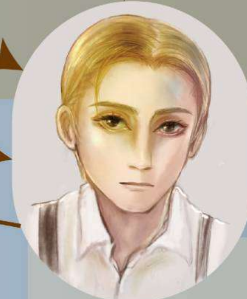
LOU / スコット・フィッツジェラルド <るー>

1920年代を代表するアメリカの小説家。 代表作には「グレート・ギャツビー」や 未完のままに終わった「ラストタイクーン」等。