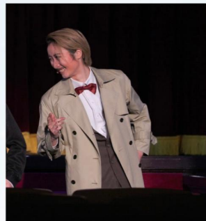
ホレス・ハードウィック (るー)

イギリス人。舞台プロデューサー。マジジの2番目の夫。 ロンドンでの新作レビューにジェリーを呼び寄せた。 彼とは少し歳の離れた親友でもある。