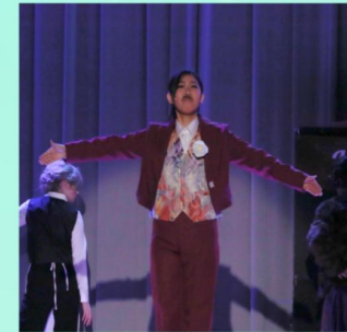
コレッリ支配人 (ひろ)

支配人としての腕はピカイチ、服のセンスはイマイチ。ベストが 後ろからチラ見えているのがなんとも。言動が変で最近髪型も 進化してるとか。従業員の間ではストレスのせいと噂されている。